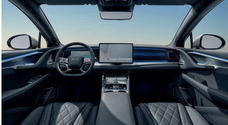
Indtræk i sort