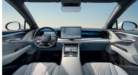
Indtræk i lyseblå (Tahitian Blue)